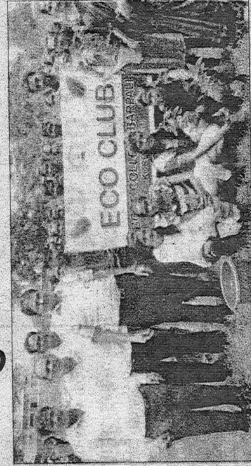
बरपाली। अतिथि समेत रासेयो छात्र-छात्राओं ने लगाए पौधे।